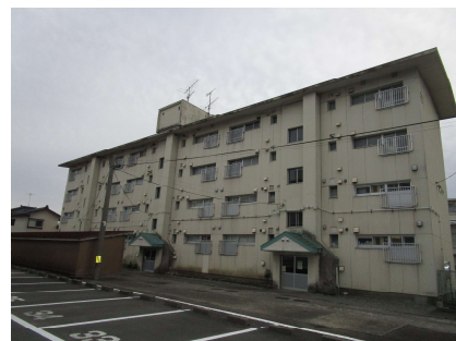
市営美原住宅1号棟外観