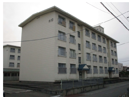
市営美原住宅10号棟外観