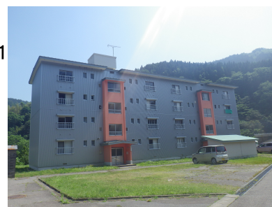
市営柳原住宅A棟外観