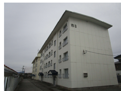
市営美原住宅8号棟外観