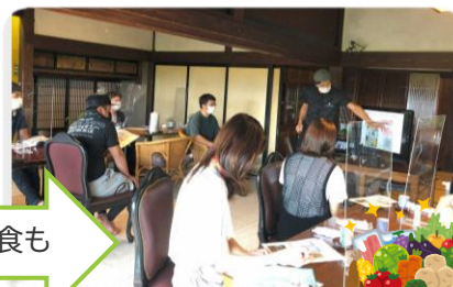
ホスピタリティ講義で昼食も