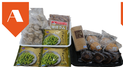
A 北家ろーる、冷凍だだちゃ豆 味付キラム肉（月山ワイン使用）など