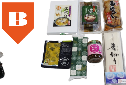
B 孟宗汁、のっけて食べるあつみかぶ 国産山菜ご飯の素、旬の季節商品など