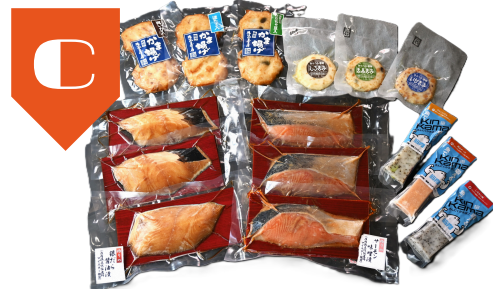
C かまぼこセット サーモン味噌漬、銀ダラ醤油漬