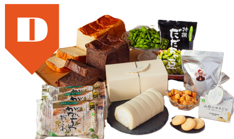
D ほわいとぱりろーる、ががちゃおこわ 許してちょんまげパンなど