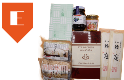
E 元禄餅、あつみまんじゅう、むぎきり 大山うどん、ブルーベリージャムなど